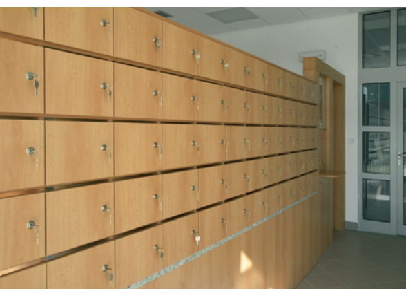
получение почты / post receipt