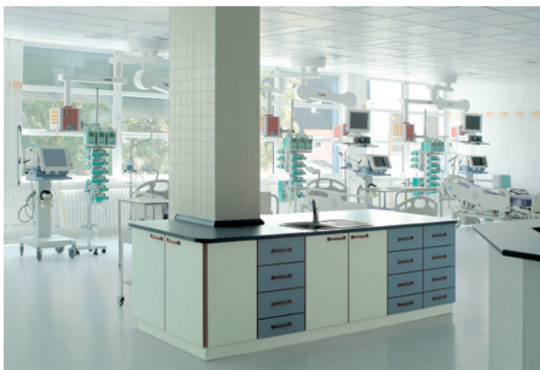
все материалы обмываемые, дезинфицируемые и экологические / all materials are washable, disinfected and ecological