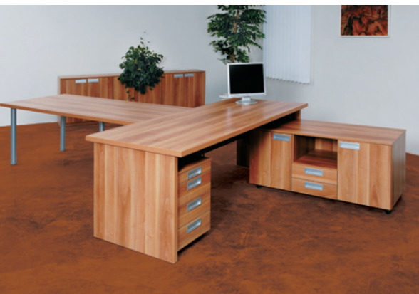
стол менеджерский / Manager table