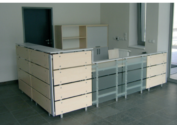
приёмная / reception