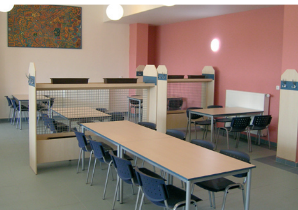
столовая / dining room