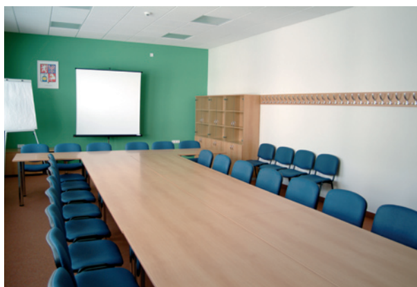
учебное помещение / training room