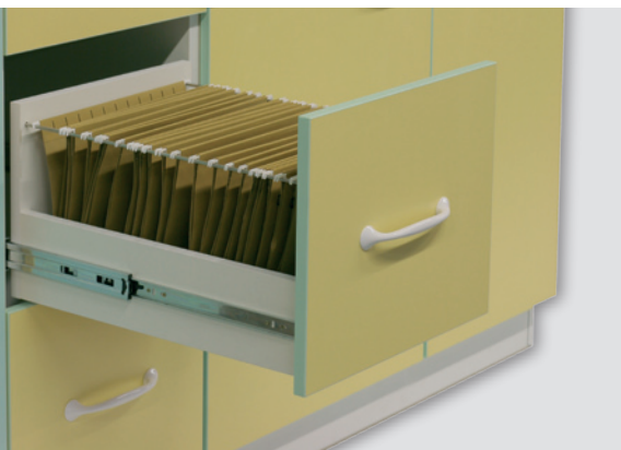
картотека / cabinet