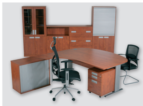
декор калвадос / calvados design