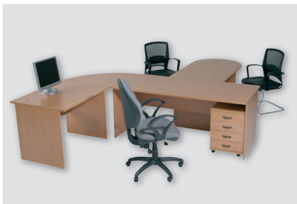
декорация ольха / alder design