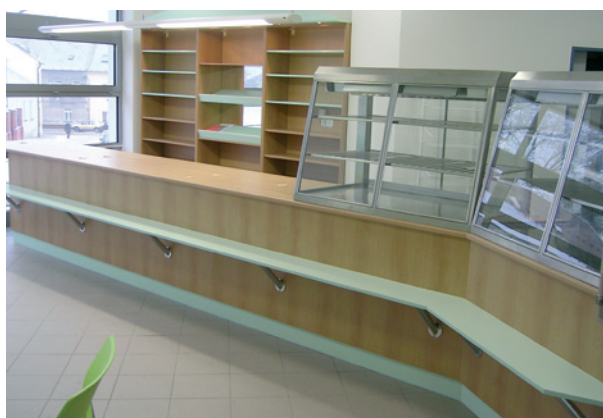
система быстрого питания / fast food