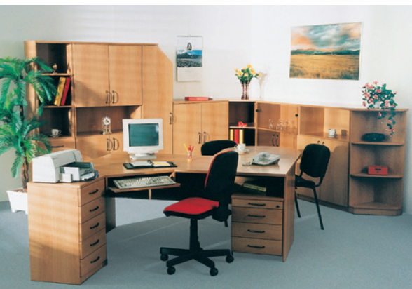
декорация бук / beech design