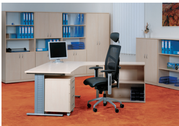
декор береза / birch design