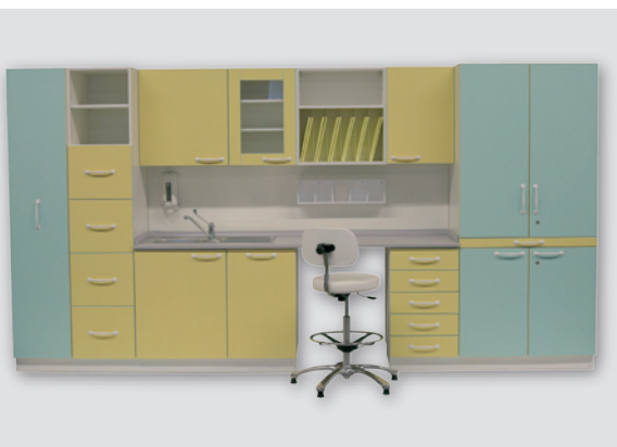
различные варианты цветного исполнения various color finishes