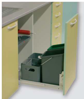
шкаф с выдвижным построением для сортирования отходов recycling storage bin