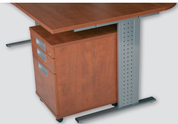
металлическое подножие / metal table stand