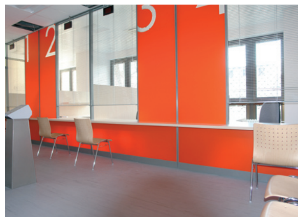
переборное отделение помещения / wall dividers