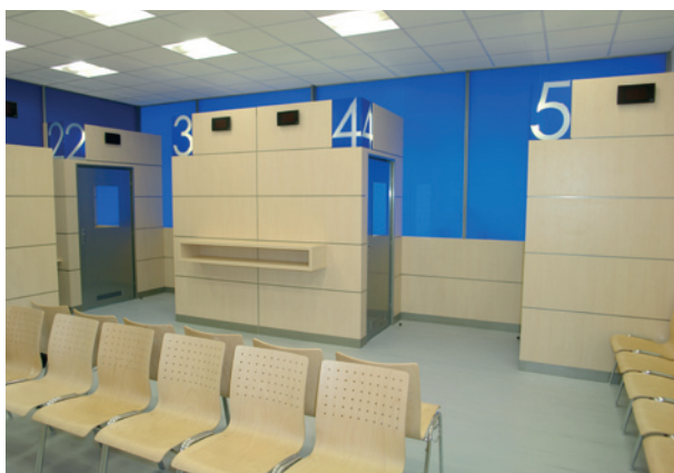
переборное отделение помещения / wall dividers