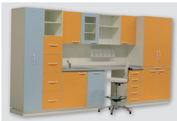
различные варианты цветного исполнения various color finishes