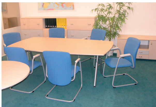
журнальный столик / meeting table