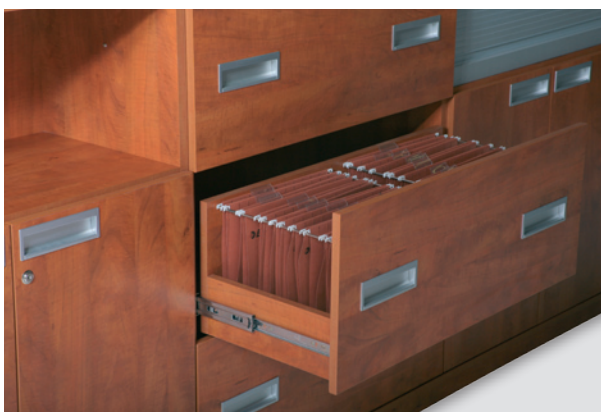
картотека с выдвижением / cabinet with a sliding shelf