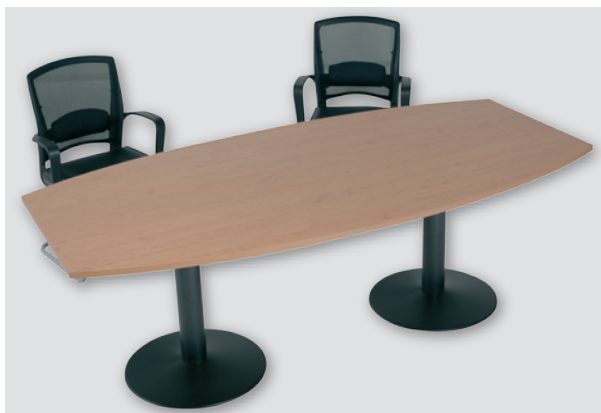
стол заседаний / Conference table